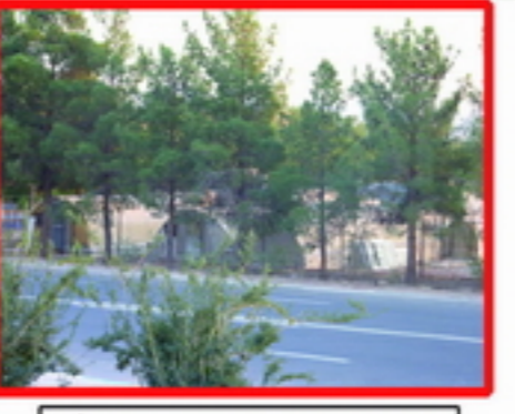
11. اغتشاش بصری به دلیل وجود سازه ناهمگون

خشکسالی های دنباله دار و خشک شدن چاه ها و مشکل آبیاری فضای سبز