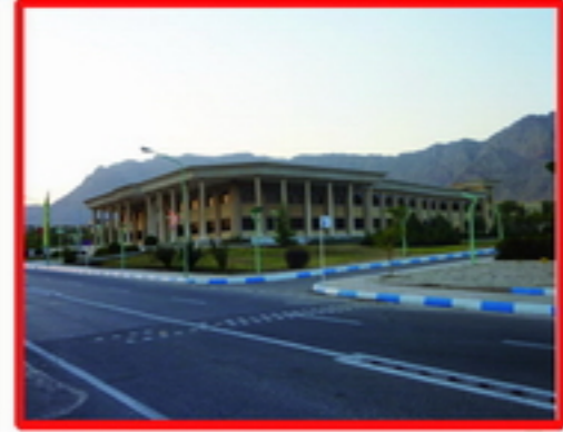
2. فقدان عنصر خاطره انگیز در سایت