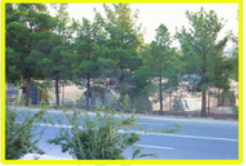
13. وجود گلدان در جلوه بصری و عدم جان