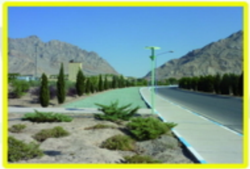
12. عدم امکان کاشت گیاه

خشکسالی های دنباله دار و خشک شدن چاه ها و مشکل آبیاری فضای سبز