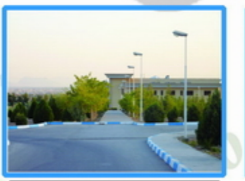
2. پتانسیل ایجاد نشانه به دلیل دید های کریدوریک