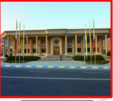
9. عدم وجود نشانه خاص در ورودی