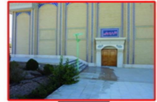
5. عدم جان فضا در ورودی و عدم جان