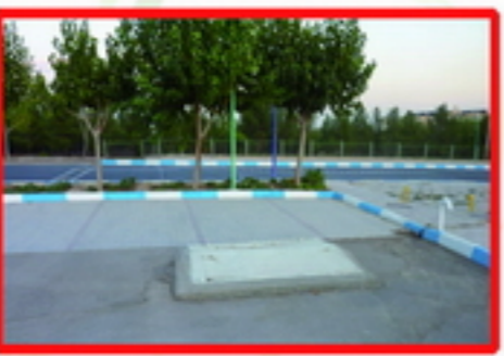
4. کمبود پارکینگ و اشغال فضای پارک