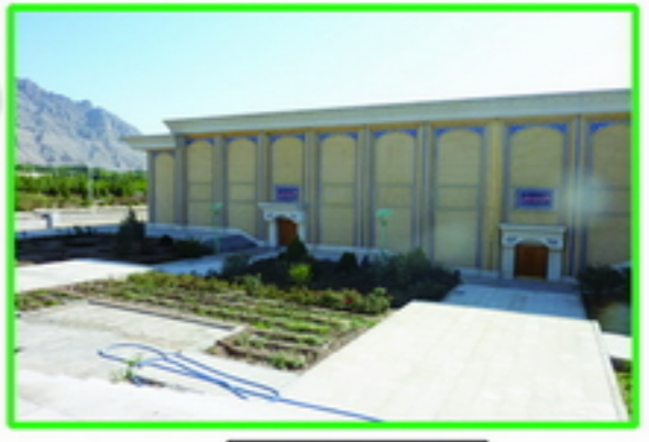
4. گسردگی فضا جهت طراحی فضا