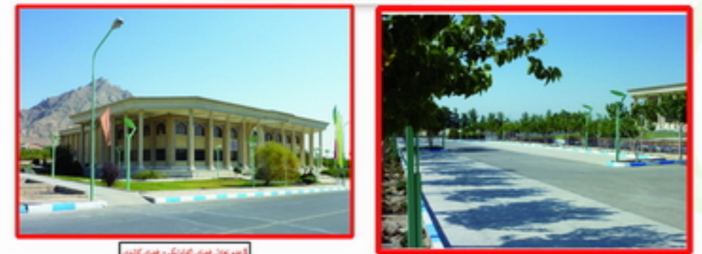
1. عدم جان فضا در ورودی و عدم جان