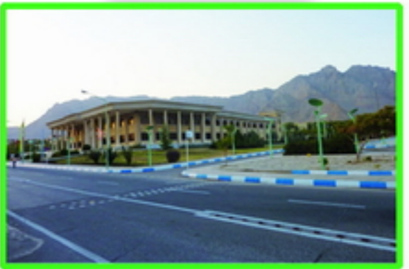
1. پتانسیل ایجاد فضای طراحی مناسب به نعل بند بصری مناسب