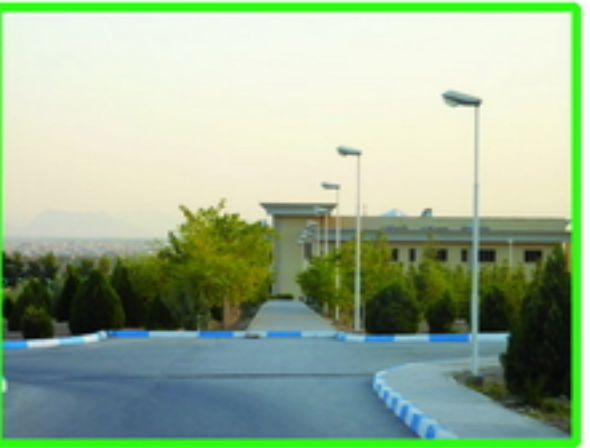
3. دید کمبود رنگ مناسب برای قرار گرفتن یک نشانه در اینجا