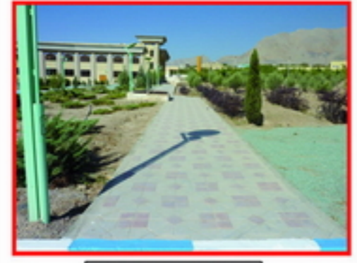
10. عدم جان فضا در ورودی و عدم جان