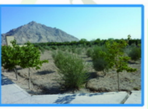
4. پتانسیل ایجاد فضای اکولوژیک اقامت کوتاه مدت