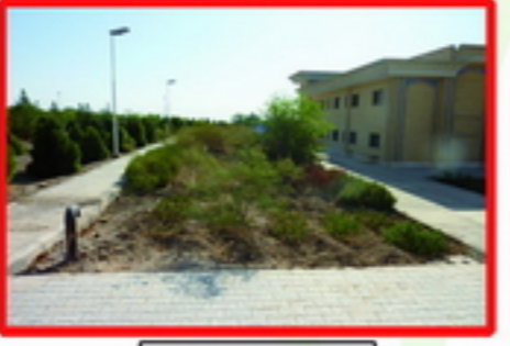
6. کمبود فضای مسیر پیاده