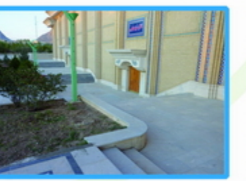
3. پتانسیل ایجاد فضای مکث و حرکت به واسطه تغییرات متوالی شیب