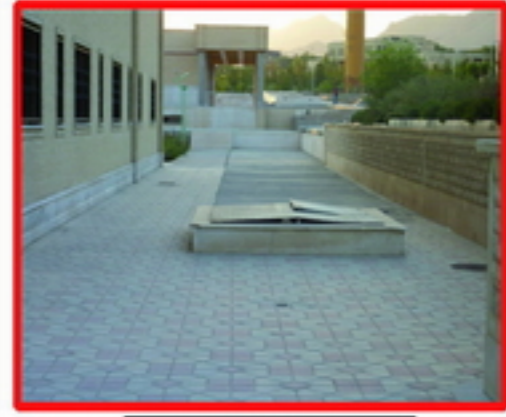
8. اغتشاش بصری و فضای هنر رفته