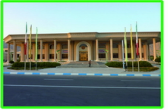
2. دید مناسب جهت طراحی جلوه بصری