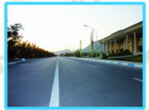
1. پتانسیل ایجاد پارکینگ در حاشیه خیابان همایش