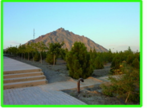
5. منظر مناسب اکولوژیک و خط آسمان ناشی از کوه