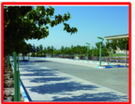
3. سایه ناکافی در کل سایت و پارکینگ