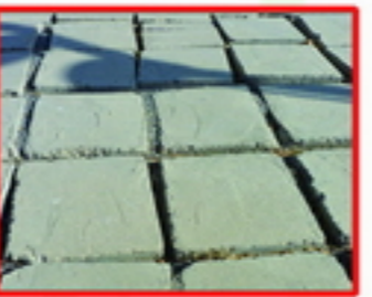
7. ناهماهنگی سنگفرش ها در سایت