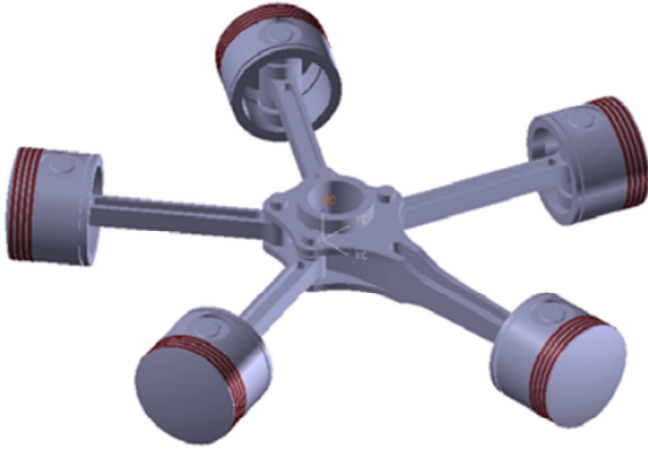
Figure 1 The Radial Engine assembly

برای شکل زیر که نقشه سوار شده یک موتور شعاعی را نشان می دهد ابتدا قطعات آن را در محیط پارت ترسیم نمایید و سپس نقشه دو بعدی اجزا آن را ترسیم نمایید.