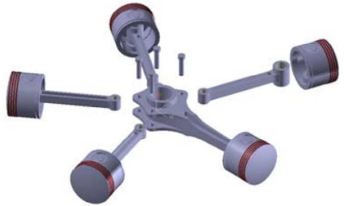
Figure 2 The exploded view of the assembly